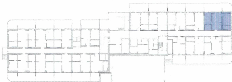
schemat lokalizacji lokalu

tech. bud. Kazimierz Miłosz Uprawnienia budowlane do kierowania robotami budowlanymi bez ograniczeń w specjalności konstrukcyjno-budowlanej i do projektowania w specjalności architektonicznej w ograniczonym zakresie Nr ewid. ZGP III/630/53/78 • POM/BO/0982/03