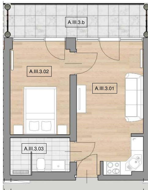
schemat lokalizacji lokalu