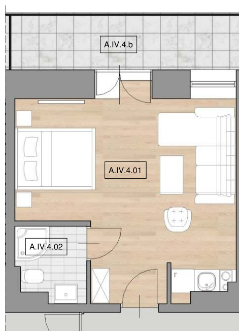
schemat lokalizacji lokalu